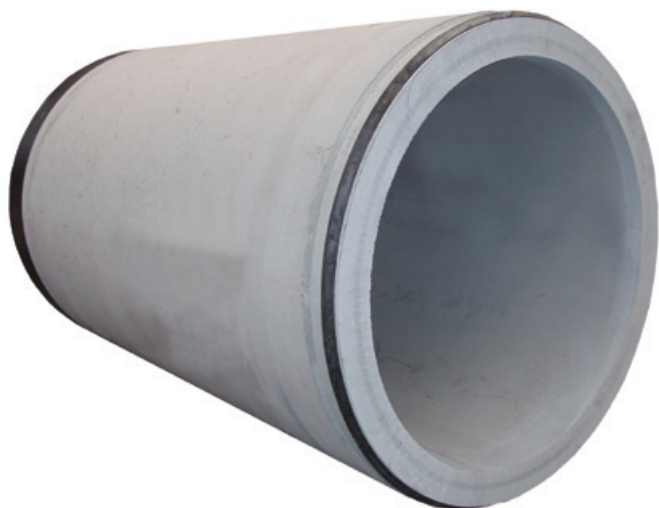
IBF Presrør set fra spidsenden.